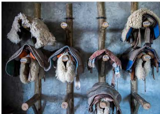
42 MONDO HUNTIKUU

Keskustasta löytyvä niemi kalasatamainen on kaupungin viehättävimpiä alueita, jossa on merenrantimia ja lihaa tarjoavia parrilla -ravintoloita. Satamasta voi tehdä veneretken liha de Loboksen länsisaarelle, jossa elää yli 200 000 merileijonaa. Se on maailman toiseksi suurin merileijonayhdyksunta. Retkellä tarjoutuu mahdollisuus uida märkäpuvussa näiden nopeiden otusten kanssa samoissa vesissä.