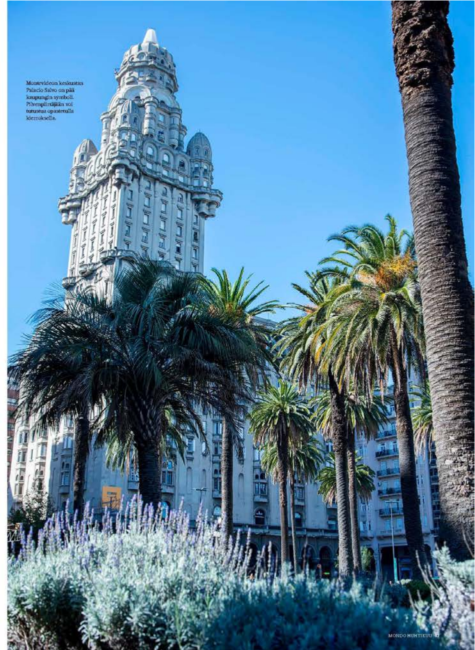
Montevideon keskeisintä Palacio Salvo on pääkaupungin symboli. Pilvenpiirtäjään voi tutustua opastetulla kierroksella.

Sitä kukaan matkailija tuskin voi jättää kaipailemaan: Uruguayssa riittää yllin kyllin muuta nautiskeltavaa. ●